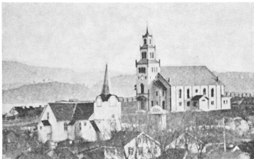
Kirken fra 1670 og kirken fra 1878.