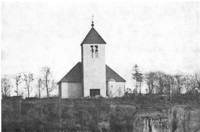
Den nye kirken, bygd 1963